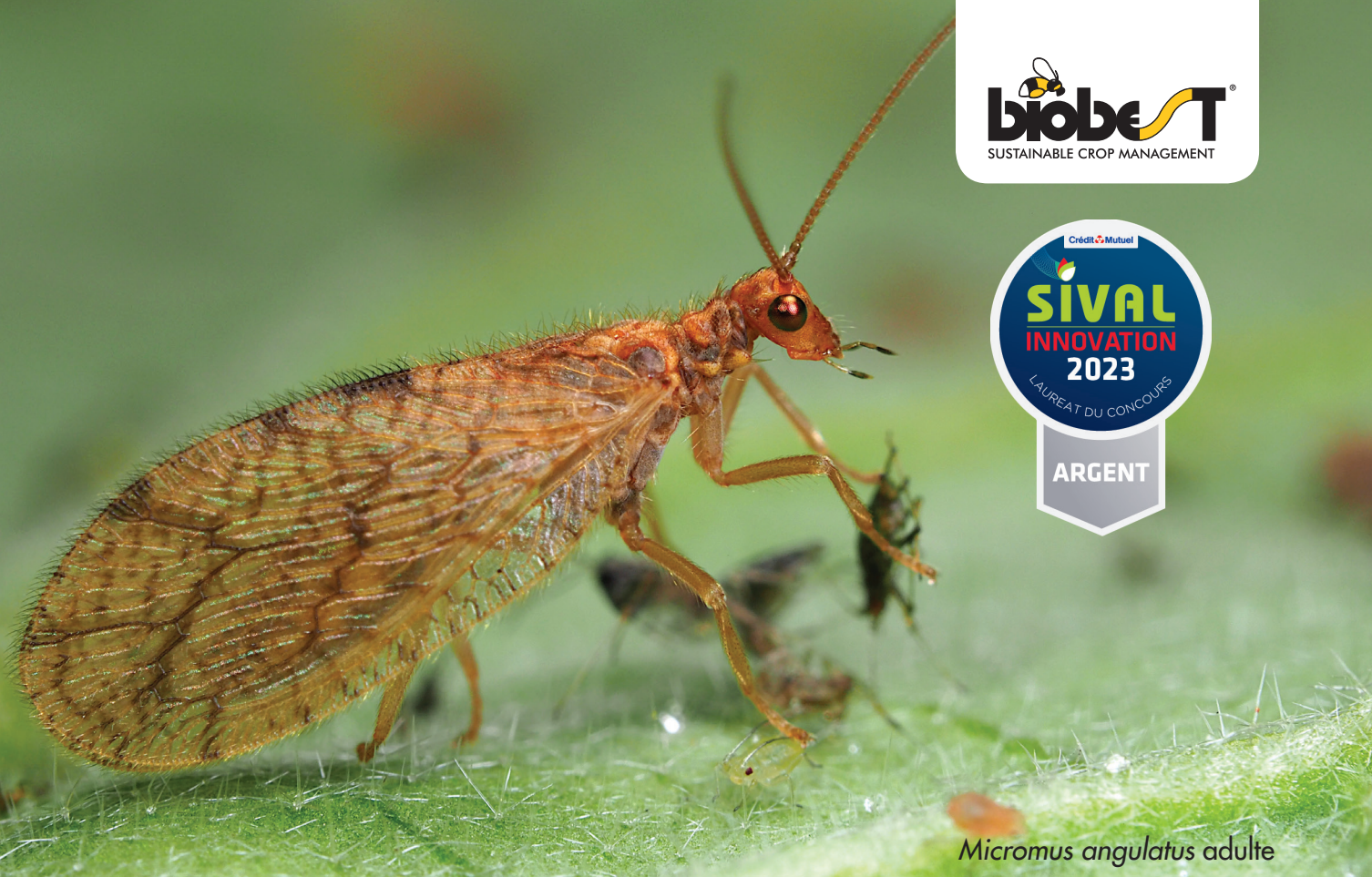
Micromus angulatus adulte